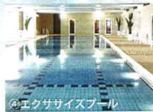
④エクササイズプール

アトラクションプールは、海水を用いておりマッサージ効果が得られるプールです。血行を促進し新陳代謝を活発にして体の老廃物をとりのぞき、健康や美容、ストレス解消に役立ちます。